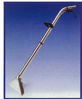
カーペットフロアツール

蔵王産業株式会社 本社/〒135-0001 東京都江東区毛利 1-19-5 TEL:03-5600-0325 FAX:03-5600-0518 http://www.zaohnet.co.jp