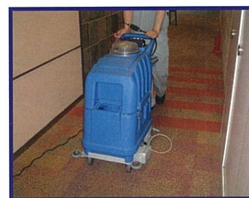
● 前進走行で操作性抜群！